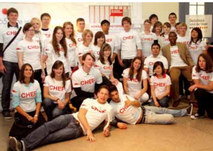
Die »Sieger 2009«.

Wissen über das Unternehmertum ist eine wichtige Grundlage für Wirtschaftswachstum und Beschäftigung. »Schüler im Chefsessel« baut eine Brücke zwischen Schule und Wirtschaft.