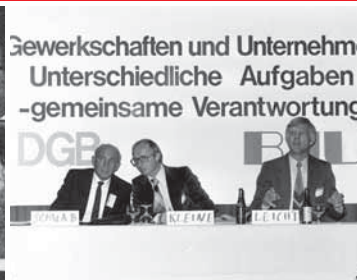
Unternehmer und Gewerkschaften

Brückenschlag: Die Jungen Unternehmer laden Vertreter des DGB zum Gedankenaustausch auf die Jahresversammlung ein: Die Frankfurter Allgemeine Zeitung würdigt die aufgeschlossene und unorthodoxe Haltung der Jungen Unternehmer.