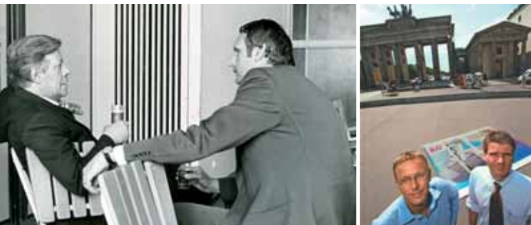
Eintreten für marktwirtschaftliche Erneuerung in Bonn und Berlin

In den 80er Jahren gerieten gesellschaftliche Ansprüche und wirtschaftliche Möglichkeiten immer mehr in Widerspruch zueinander. In dieser Situation