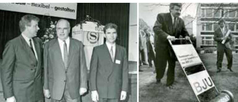
Prominente Gäste konnte der BJU schon immer bei sich begrüßen

In den 60 Jahren seines Bestehens ist unser Verband aber stets mehr als eine politische Interessenvertretung gewesen. Er hat auch den Zusammenhalt der Mitglieder untereinander gefördert: Junge Unternehmer haben in den zurückliegenden Jahrzehnten zahllose Kontakte mit anderen jungen Unternehmern geknüpft. Das reicht von geschäftlichen Verbindungen bis zu Freundschaften fürs Leben. Damals wie heute sind »Die Jungen Unternehmer – BJU« eine Plattform für